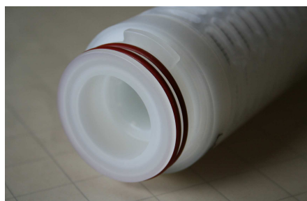
Baïonnette + O-ring

Séparation : Liquide/Solide Matériel : FILTRE Média : consommable TECHNIQUE